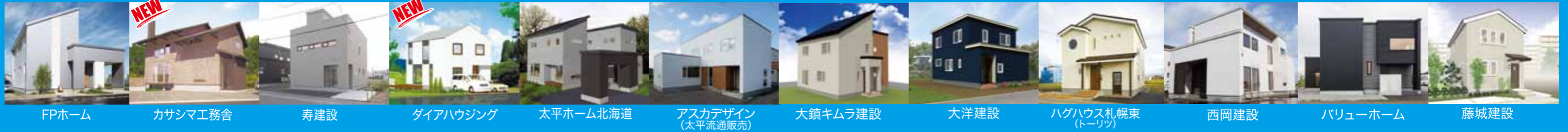
FPホーム カサシマ工務舎 寿建設 ダイアハウジング 太平ホーム北海道 アスカデザイン (太平流通販売) 大鎮キムラ建設 大洋建設 ハグハウス札幌東 (トリーツ) 西岡建設 バリューホーム 藤城建設