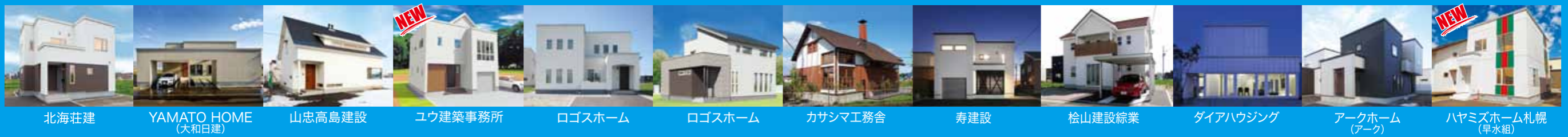
北海荘建 YAMATO HOME (大和日建) 山忠高島建設 ユウ建築事務所 ログスホーム ログスホーム カサシマ工務舎 寿建設 桧山建設総業 ダイアハウジング アークホーム (アーク) ハヤミズホーム札幌 (早水組)